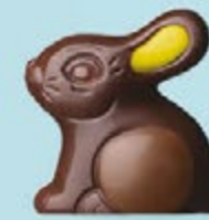
Praliné et éclats d'amandes caramélisées